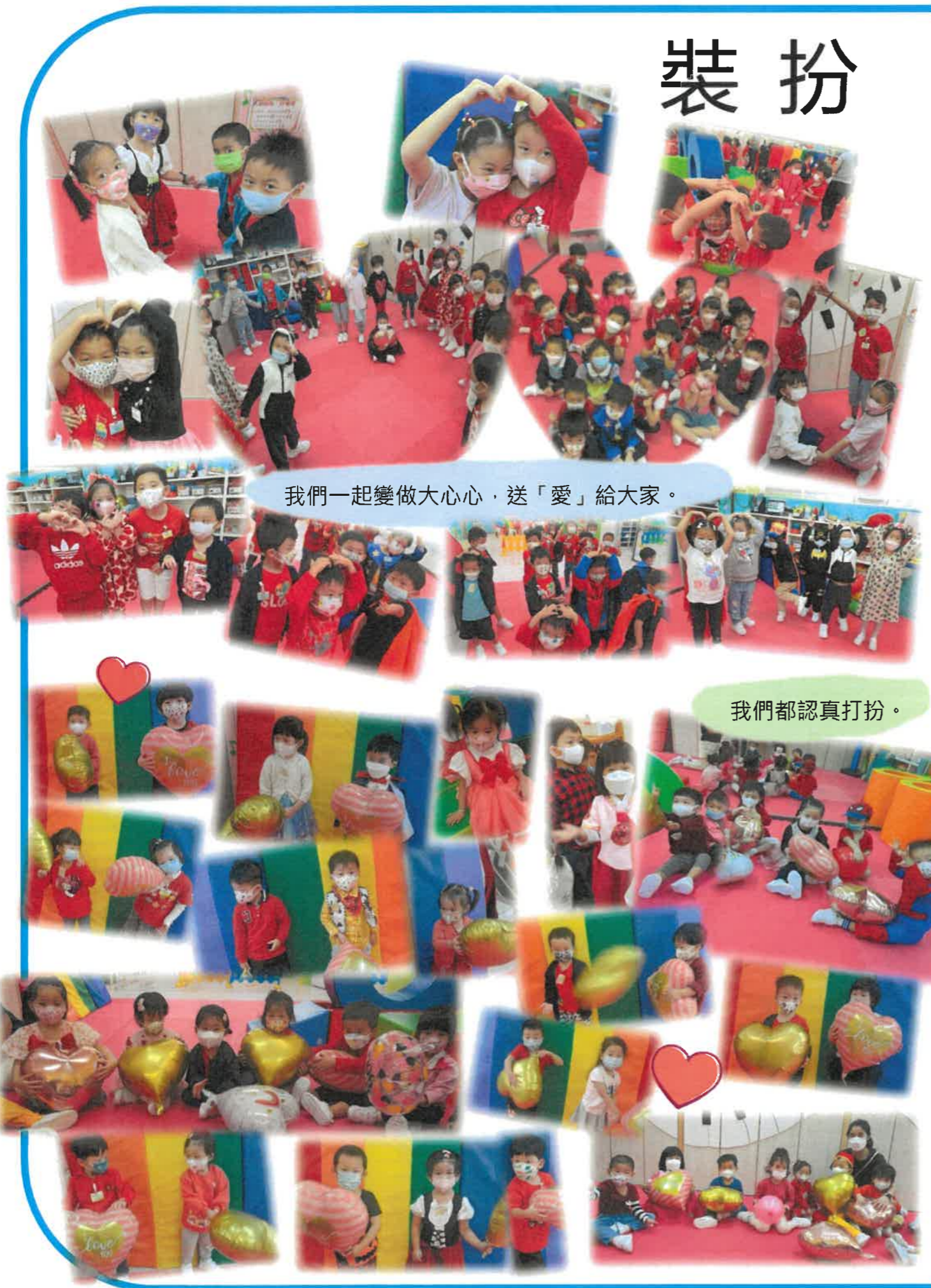
我們一起變做大心心，送「愛」給大家。