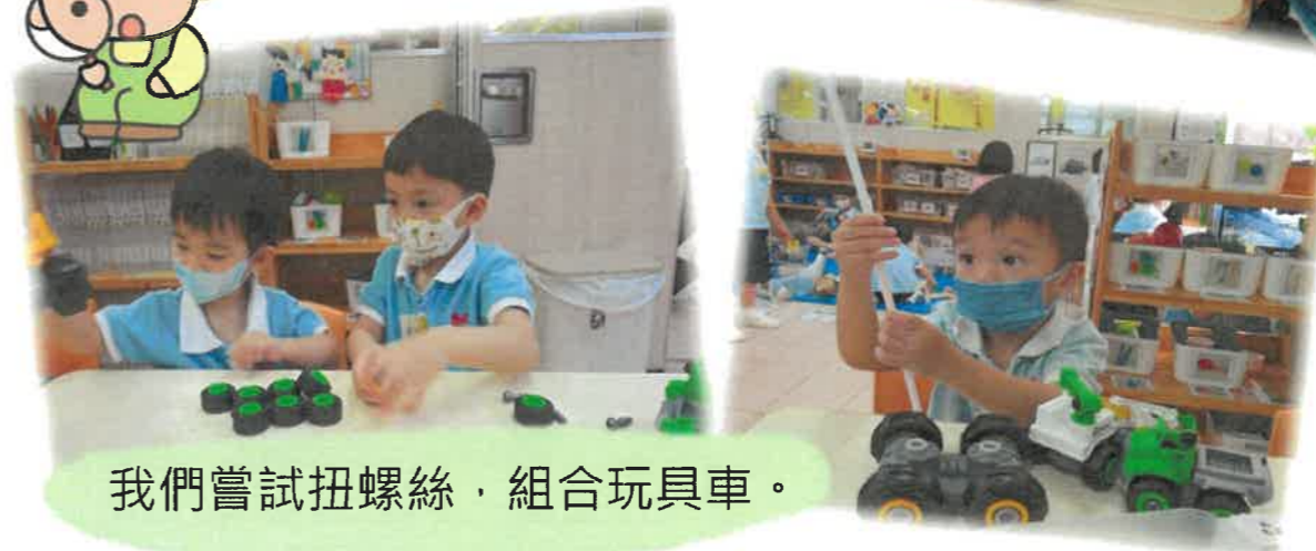
我們嘗試扭螺絲，組合玩具車。