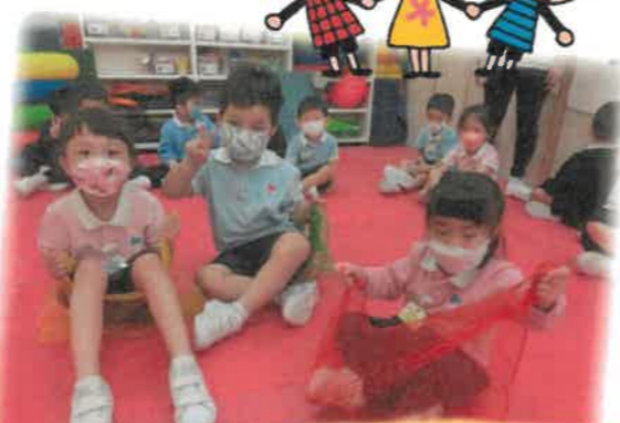
我們一起玩音樂遊戲。