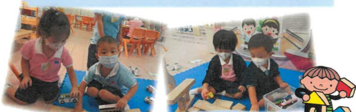
我們一起拼馬路及動物園。

透過不同的科學活動，培養幼兒對究物的好奇心及勇於探究的精神，增強學習興趣及自信心，亦讓幼兒認識身邊的世界，能從小關心愛護大自然。