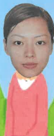
聯絡 李明女士 (朱凱琪家長)