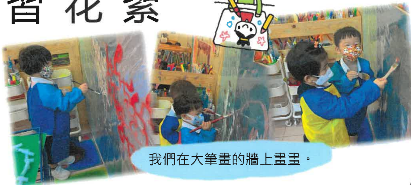
我們在大筆畫的牆上畫畫。