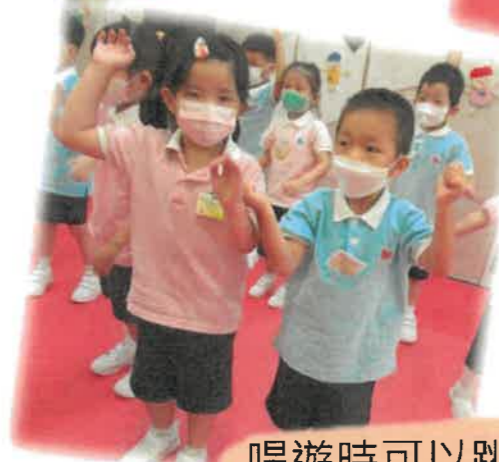
唱遊時可以跳舞和玩樂器。