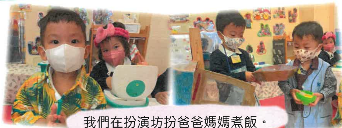
我們在扮演坊扮爸爸媽媽煮飯。