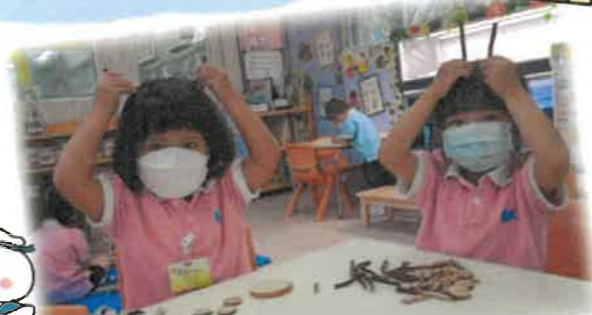
我們玩邏輯思維教具。