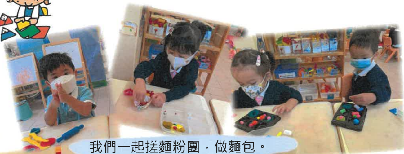
我們一起搓麵粉團，做麵包。