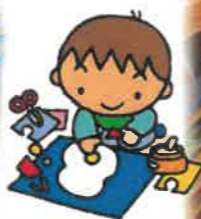
視覺藝術區的創作活動真有趣。