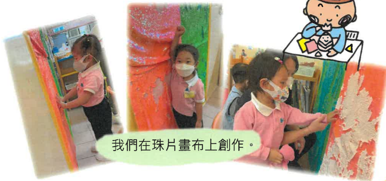
我們在珠片畫布上創作。